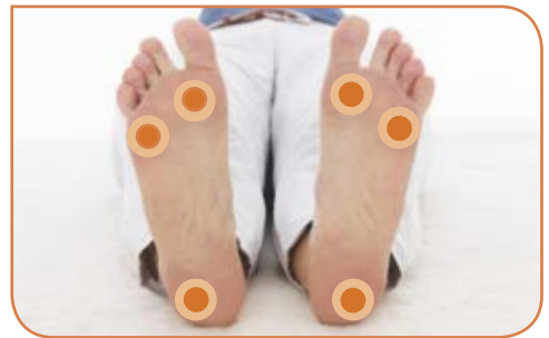
Abb. 5: Drei-Punkt-Belastung der Füße beim Stehen

Wenn wir bei den folgenden Übungen die Anleitung geben, mit beiden Füßen ganzflächig auf dem Boden zu stehen und Erdung zu haben, meinen wir damit die 3-Punkt-Belastung, nämlich Fersenaußenkante, Großzehenballen und Kleinzehenballen (vgl. Abb. 5).